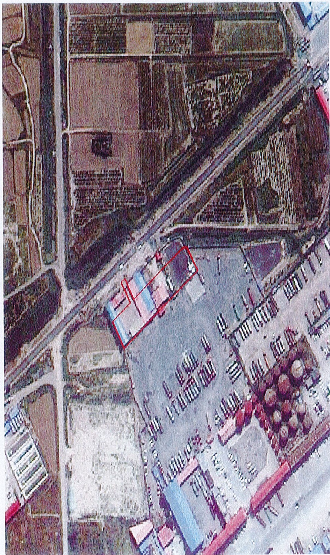
黄骅市 2025 年度第 30 批次建设用地图 (刘皮庄)