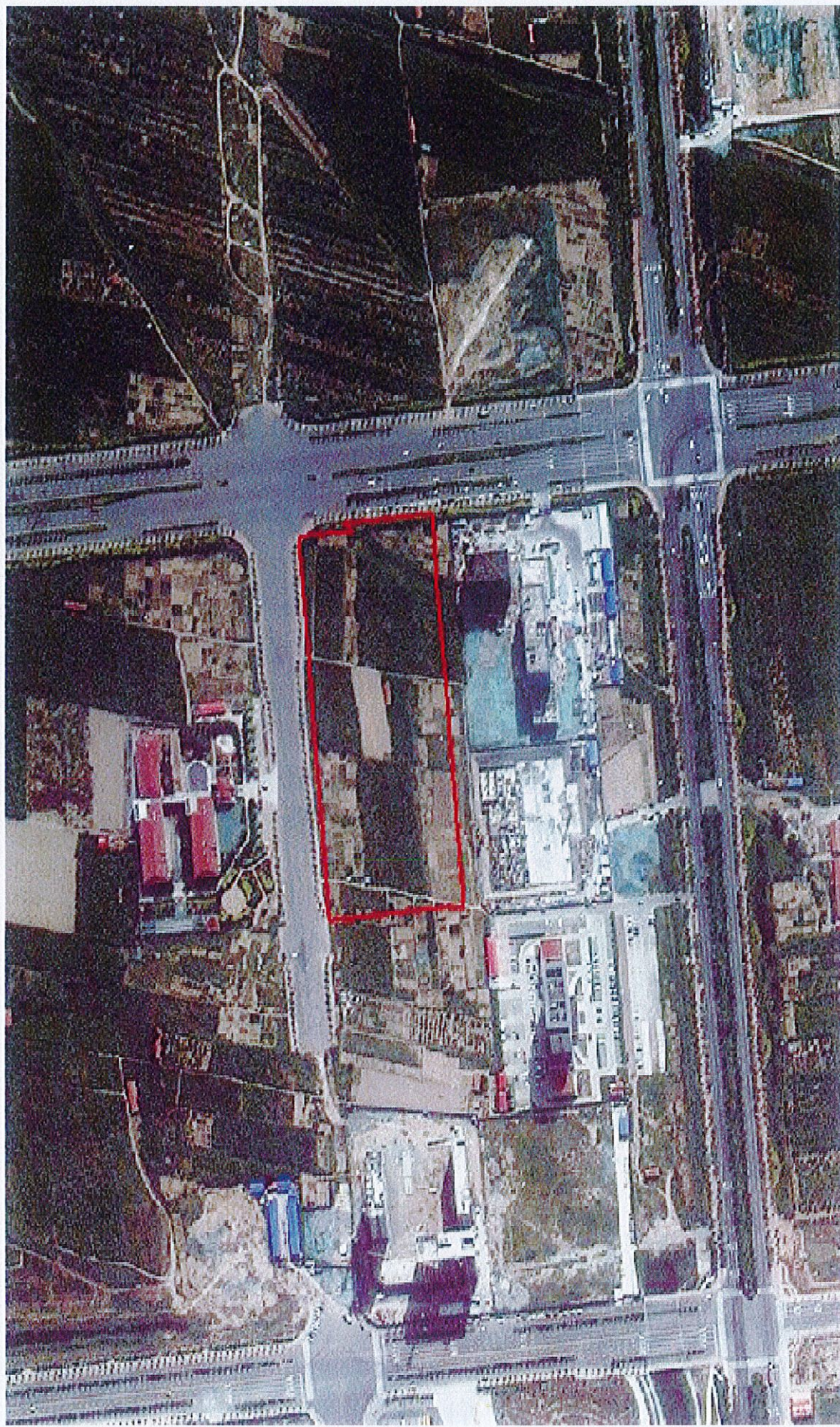
黄骅市 2025 年度第 30 批次建设用地地块 2 征地范围图（三幼南侧停车场东商业地块）