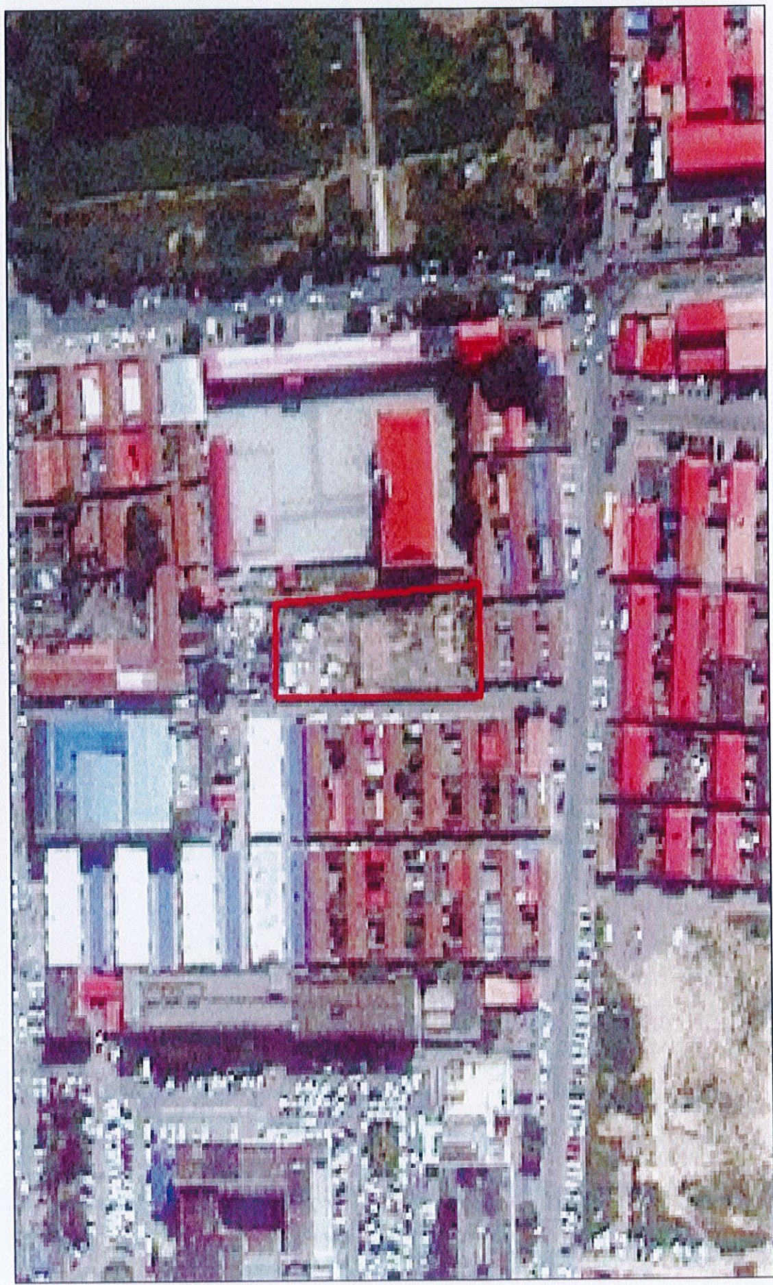
黄骅市 2025 年度第 30 批次建设用地块 1 征地范围图（沈庄小学）